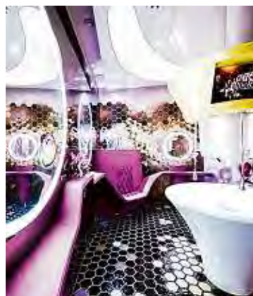
Auch die Toiletten wurden umgestaltet