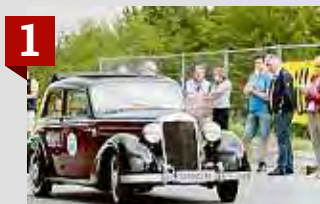
1 Klassiker am Start

timertreffen Krumegg (Sonntag) waren ein Riesenerfolg. Tausend Besucher bestaunten 60 Oldtimer, die eine Rundfahrt von Krumegg via Schöckl bis nach Petersdorf II führte.