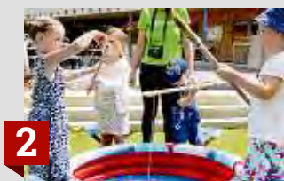
2 Viel Spaß im Kinderdorf