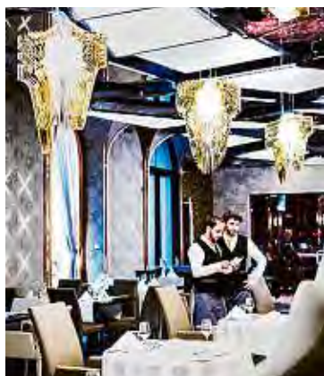
Erdtöne treffen bei der neuen Einrichtung auf goldene Akzente