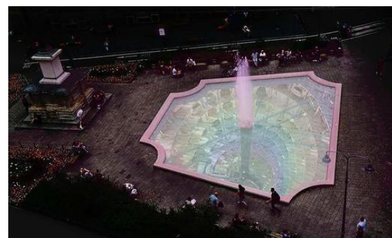
in Graz ein Aufreger, in Cannes aufsehenerregend.

„Wir sind fast sprachlos und fühlen uns geehrt, dass unser Smart Urban Park System in der Fachwelt so viel Anerkennung findet. Wir sind stolz, das ganze Team hat hier etwas ganz großartiges geleistet“, hatte Strohecker im Jänner gemeint, kurz nach der Nominierung seiner Bienenwaben-Garage für "Future Project Awards 2018" in Cannes.